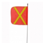
Antena pertiga 8 pies