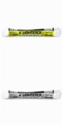
Barra Fluorescente Northern Light

Lámina de alta duración y gran visibilidad para aplicar en señales de tránsito, camiones, camionetas, transporte escolar, vehículos comerciales, carros de arrastre, remolques, buses y otros vehículos u otros usos seguridad del tráfico.