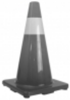
Cono seguridad una cinta 45 cms