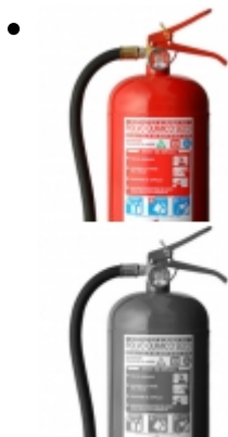
Extintor PQS 4kg Start Fire