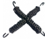
Tensor de cadena

Lámina de alta duración y gran visibilidad para aplicar en señales de tránsito, camiones, camionetas, transporte escolar, vehículos comerciales, carros de arrastre, remolques, buses y otros vehículos u otros usos seguridad del tráfico.