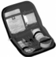
Botiquin Vehicular DH-6018

Las cintas reflectivas son fundamentales para la seguridad en entornos de trabajo pesado como por ejemplo en la minería. También son utilizados por vehículos de transporte y de pasajeros o en situaciones de poca visibilidad, inclusive son adheridas a elementos que necesitan resaltar y destacar su posición aportando seguridad al entorno.