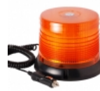
Baliza ambar LED WL49