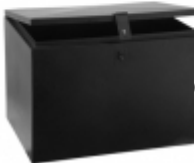
Caja camioneta minera