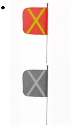
Antena pertiga 8 pies

Lámina de alta duración y gran visibilidad para aplicar en señales de tránsito, camiones, camionetas, transporte escolar, vehículos comerciales, carros de arrastre, remolques, buses y otros vehículos u otros usos seguridad del tráfico.