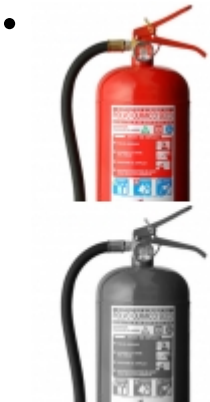
Extintor PQS 4kg Start Fire