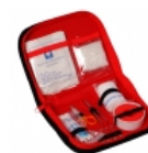
Botiquin Vehicular DH- 6018