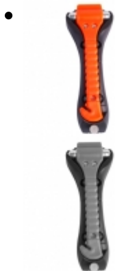
Martillo - corta cinturon

El sistema de seguridad de traba tuercas está ideado para proteger y asegurar las tuercas de las ruedas de los vehiculos que transitan constantemente fuera de caminos pavimentados. Los traba tuercas impiden que la vibración actue sobre los pernos o tuercas de las ruedas soltando o perdiendo el apriete.